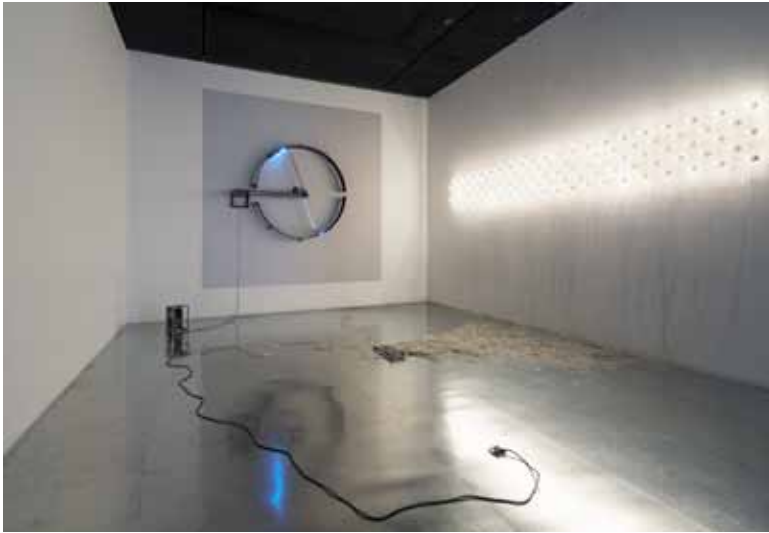
タムラサトル 「100の白熱灯のための接点#2」 ※参考作品