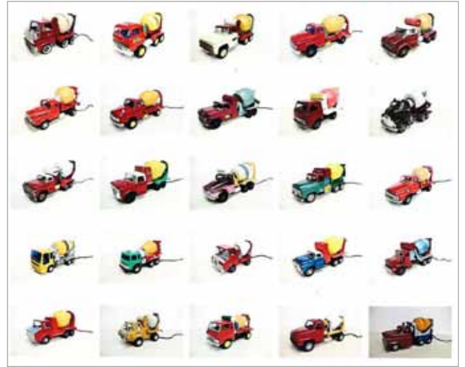
市川平 「MAGICAL MIXER PROJECT」